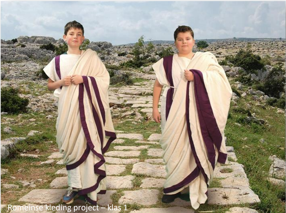
Romeinse kleding project – klas 1

Heeft u vragen over boeken bestellen, dan kunt u per e-mail contact opnemen met mw. A. (Analisa) Boelijn: aboelijn@celeanum.nl